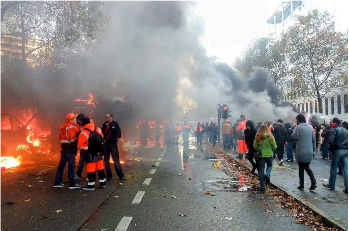
En novembre 2014, la manifestation contre les mesures d'austérité avait pris une tournure violente.

Quand la droite est au pouvoir, la gauche reprend la rue. En 2014, lorsque Charles Michel (MR) a pris la tête d'un gouvernement de centre-droit (MR, N-VA, CD&V et Open VLD), la Belgique a connu des mouvements de protestation d'une ampleur inédite. Le 6 novembre, plus de 100 000