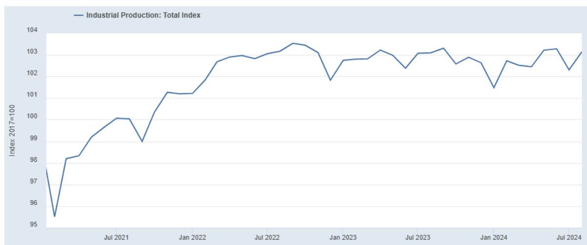
Figure 3. Production industrielle aux Etats-Unis (2017=100)