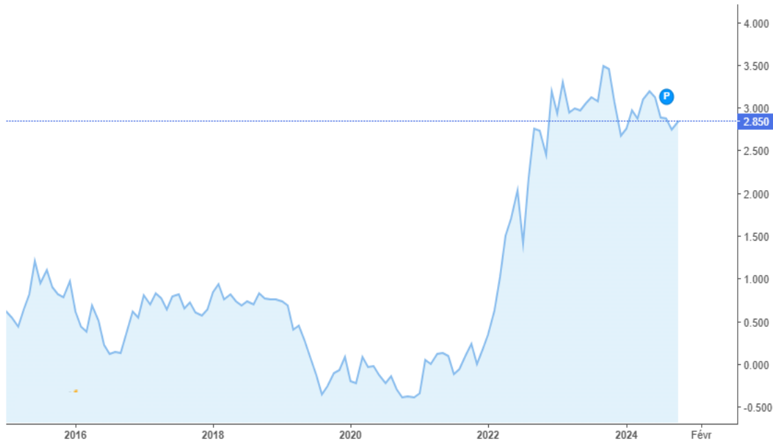
Figure 1. Taux d'intérêt des OLO (obligations linéaires) à 10 ans. Dette à 10 ans de l'Etat belge. Evolution 2014-2024.